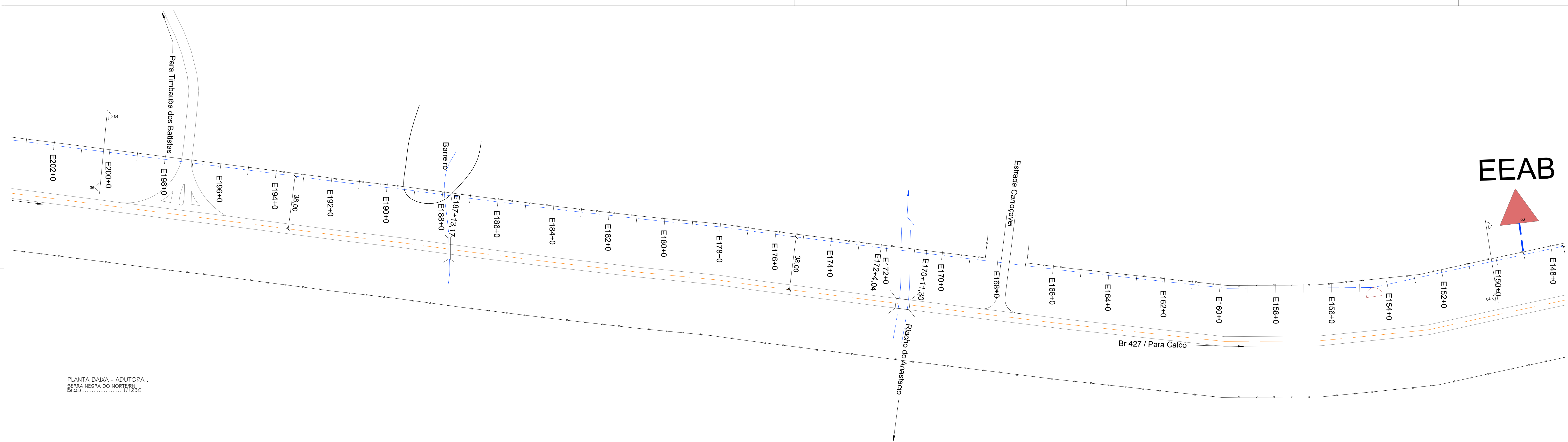
PLANTA BAIXA - ADUTORA . SERRA NEGRA DO NORTE/RN Escala:..... 1/1250