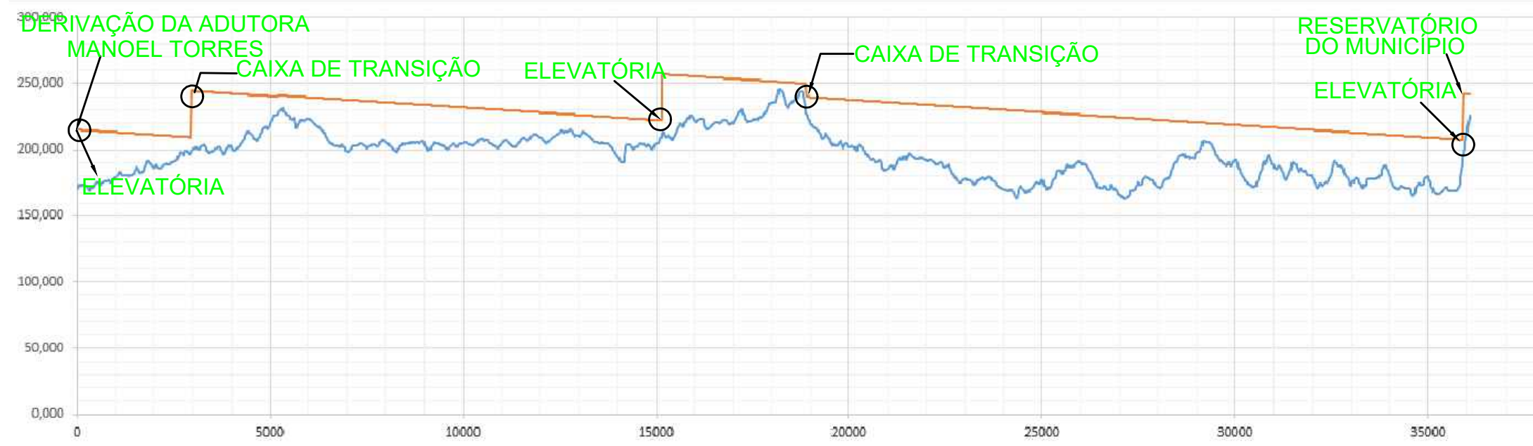
TUBULAÇÃO LINHA DE CARGA EFETIVA OU PIEZOMÉTRICA